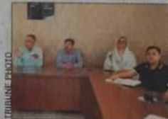
Panelists at the workshop.

This workshop aimed to enhance Information and Communications Technology-based content delivery to students, aligning with the college's initiative to implement an ERP system. This system will provide students with comprehensive access to academic and administrative information via their mobile