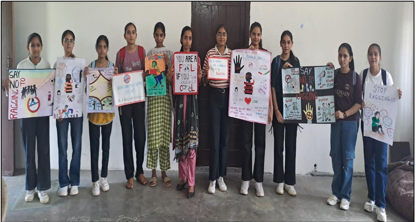
Students participated in Slogan and Poster making competition